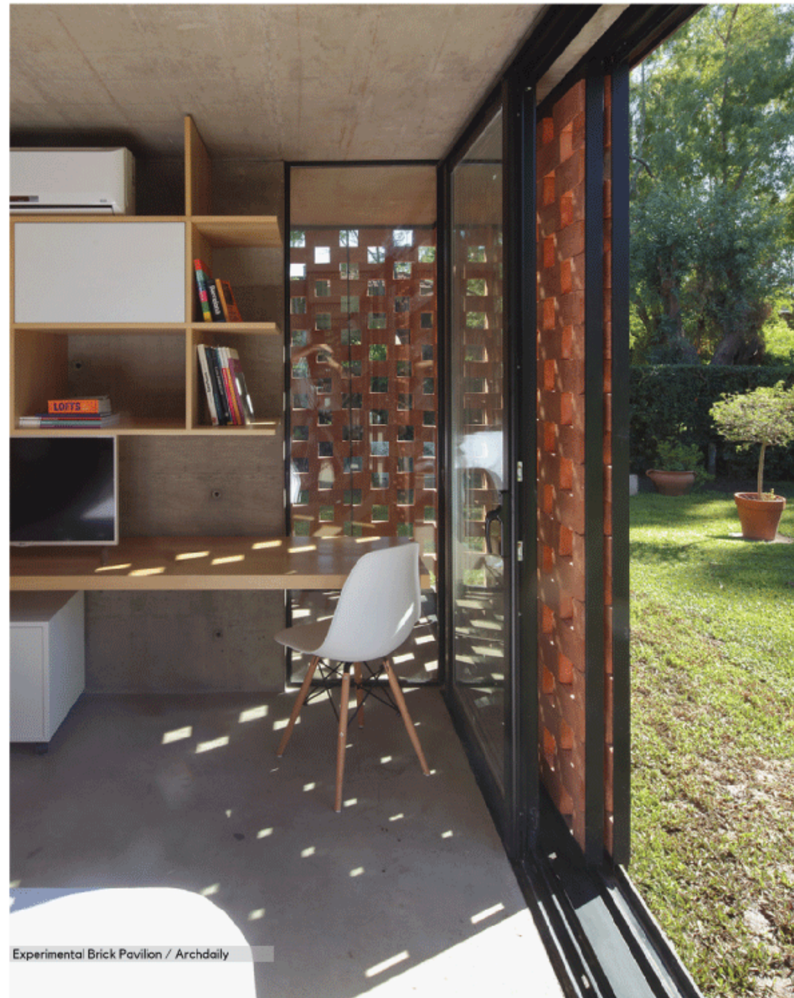
Experimental Brick Pavilion / Archdaily

Elemen ini bisa digunakan pada berbagai fungsi bangunan. Dan bisa diaplikasikan dalam berbagai bentuk, material, dan pola.